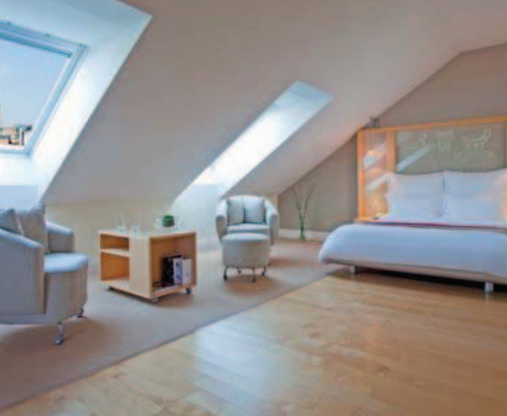
Une chambre de luxe du Méridien

InterContinental***** (458 chambres) : le seul représentant de la chaîne en Autriche et l'une des grandes adresses du secteur Mice. Au cœur du troisième arrondissement, l'ensemble rénové en 2009 dispose de 2 restaurants, 2 bars et d'un lounge, d'un fitness center et d'un centre de conférence (17 salles de 14 à 800 places).