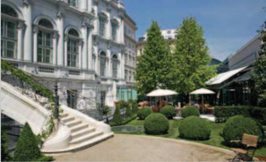
Le jardin du Palais Coburg

On recense près de 27 000 chambres classées dans la capitale autrichienne. Un parc ou les cinq étoiles occupent le devant de la scène avec, à côté des établissements historiques (Sacher, Imperial, Grand Hotel, Bristol), de nouvelles adresses branchées (Sofitel) et des demeures de charme (Le Palais Coburg). Si l'accent doit désormais être mis sur une hôtellerie 3 étoiles qui fait encore défaut, les projets