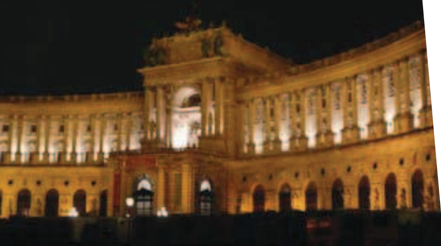
La Hofburg Vienna