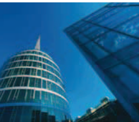
Le Messe Wien Exhibition & Congress Center