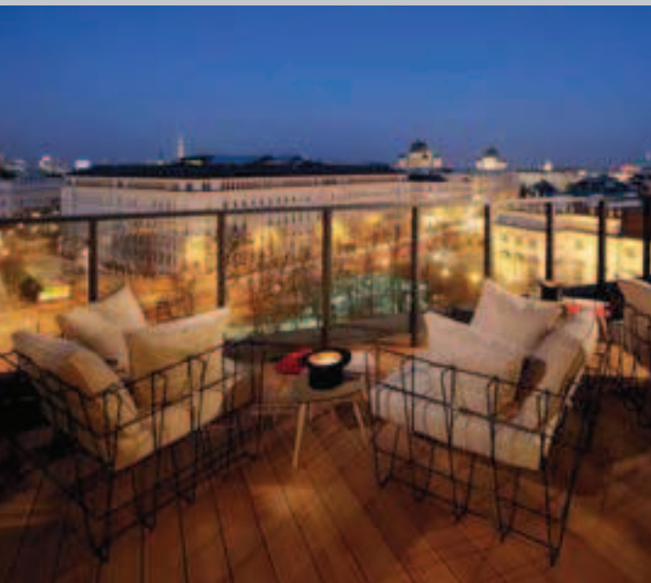
La terrasse du Twenty Five Hours Hotel

extension de 187 chambres du Twenty Five Hours. Restaurant, bar, terrasse.