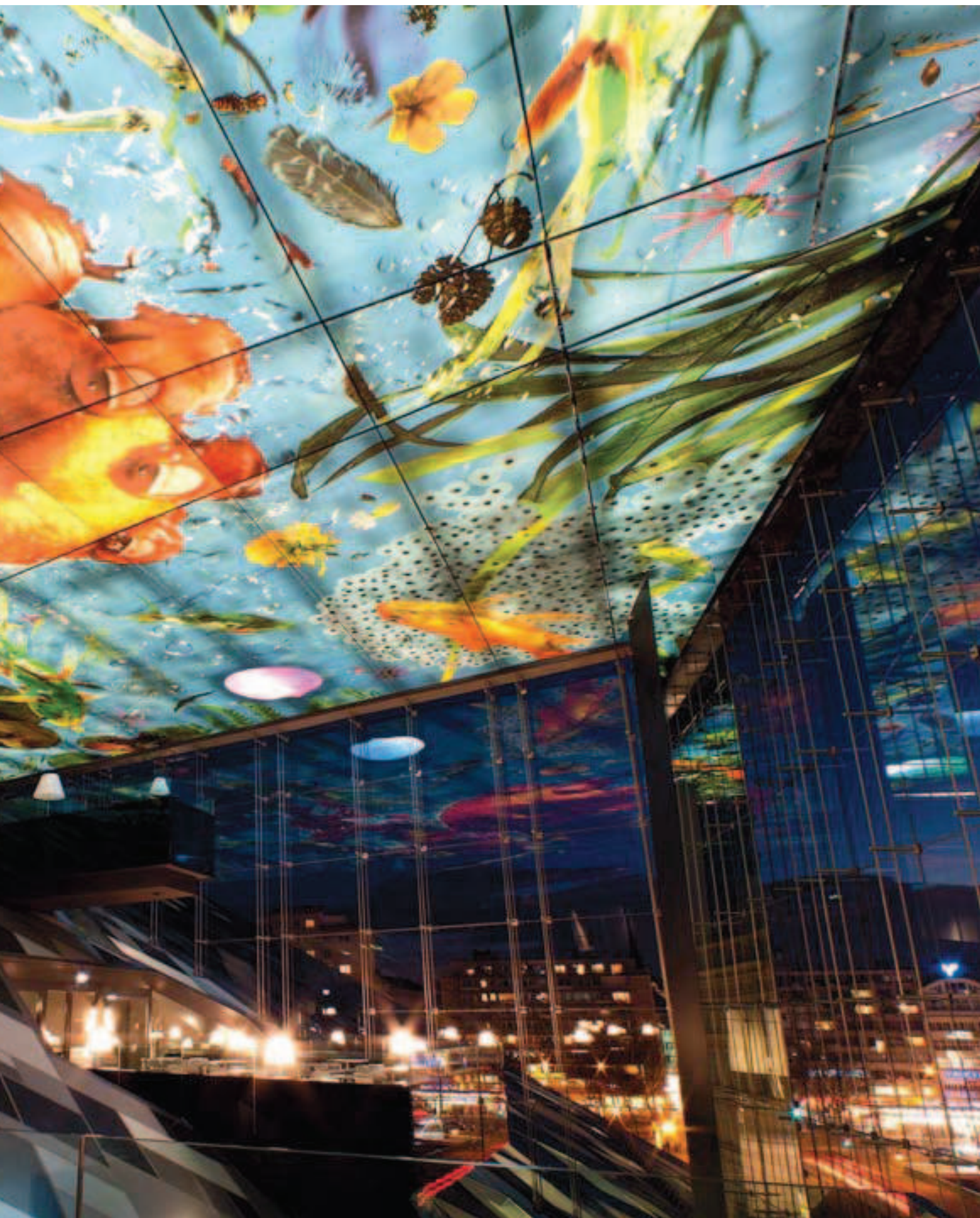
Le Loft du Sofitel Vienna Stephansdom