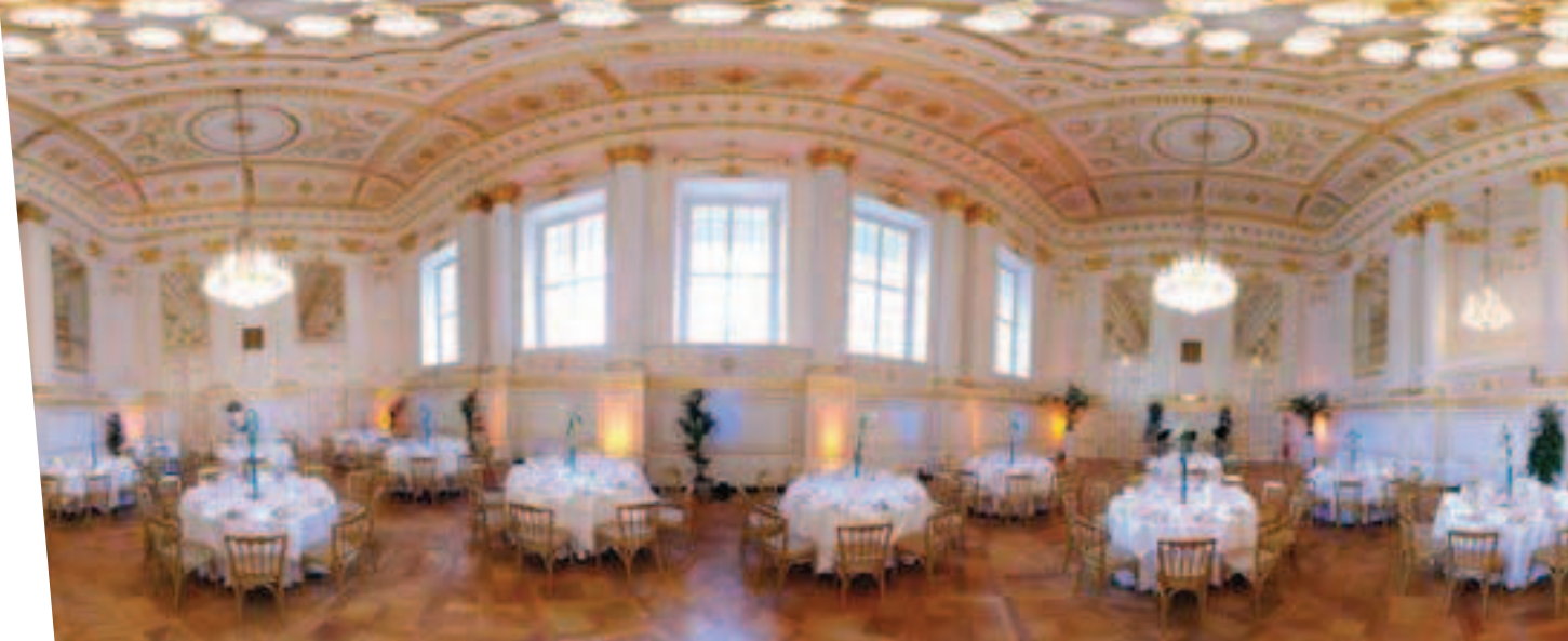
Soirée de Gala à la Hofburg

Vestibuel , dans le Théâtre National Burgtheater (carte gastronomique, 40 places), Motto Am Fluss , sur le canal, dans l'enceinte de l'embarcadère dédié aux croisières vers Bratislava (carte régionale et internationale pour 120 personnes, terrasse pour 250 personnes), Griechenbeisl , une institution datant du XV ème siècle fréquentée de tout temps par les artistes et célébrités (cuisine viennoise, nombreux salons pour 240 personnes + terrasse), Zum Schwarzen Kameel , autre adresse historique du début du XVII ème siècle (ambiance cave, cuisine robotisée pour 120 personnes), Hollmann , table d'hôtes de cuisine organique (100 places), Skopiklohn , près du Sofitel (cuisine traditionnelle, 50 couverts), Eisvogel , dans l'enceinte du Parc Prater (cuisine internationale, 120 places), Palais Coburg , pour la table étoilée du Chef Silvio Nickol (50 places).