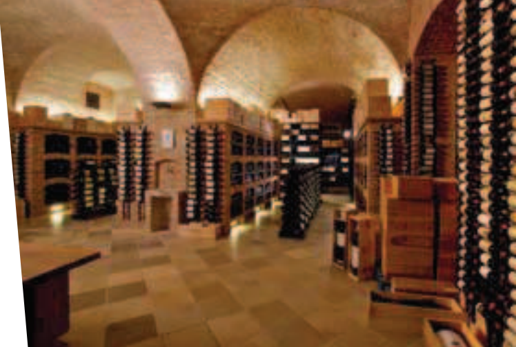
La cave du Palais Coburg

Restaurants : Badeschiff , la table tendance du Chef Christian Petz, installée sur une barge-piscine près du Sofitel (cuisine autrichienne revisitée, 50 places + terrasse), Plachutta Gasthaus zur Oper , un nouvel établissement près de l'Opéra (cuisine viennoise, 60 places), Wirtshaus , la table du Musée Kinsky (cuisine viennoise allégée, 60 places + terrasse de 30 places), Hansen , au sous-sol de l'ancienne Bourse (70 places),