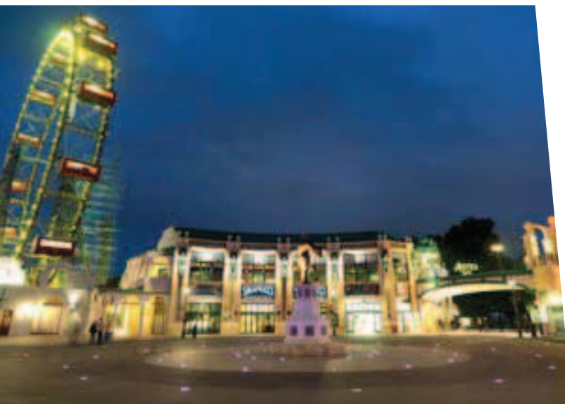
La Grande Roue du Parc Prater

d'un grand Chef, visite d'une chocolaterie ou d'une manufacture de vinaigre, balade dans le centre de la capitale et visite des appartements royaux de la Hofburg avec intervention de comédiens campant des personnages de la cour, après-midi au Parc Prater , un lieu festif où se concentrent nombre d'attractions (grande roue, Musée de Madame Tussauds, Vienna Airlines) et de restaurants, dégustation de vins dans les vignes de Grinzing et de Heiligenstadt (dans le XIX ème arrondissement) avec transfert en vieilles rames de tramway et visite des caves. On recense quelques 600 vignerons sur les 700 hectares de vignes de cette zone à flanc de coteaux située au nord de la ville.