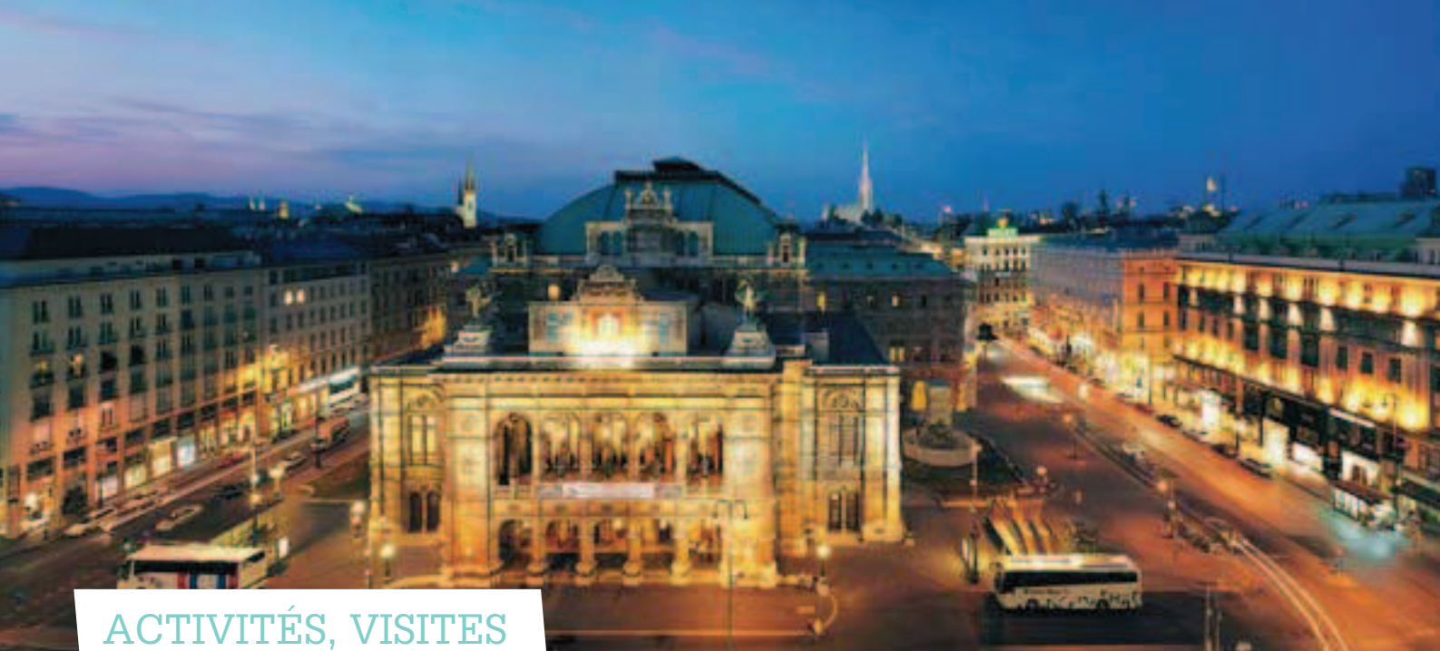
La place de l'Opéra