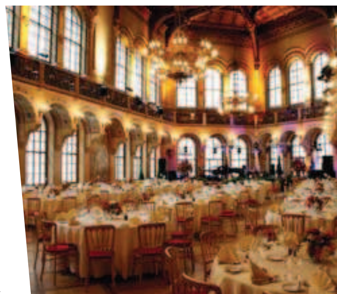
La salle d'apparat du Palais Ferstel