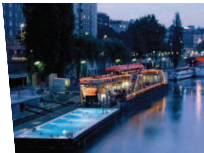
Badeschiff sur le canal du Danub