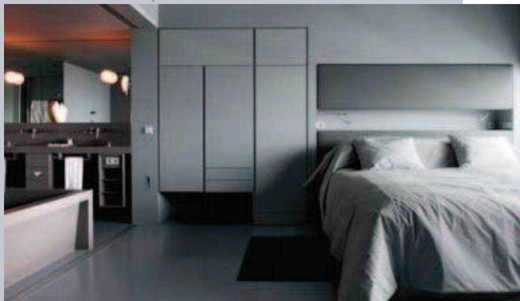
Une suite Grise du Sofitel Vienna Stephansdom

Hilton**** (579 chambres) : le plus grand hôtel de Vienne et l'un des piliers de l'activité Mice. Près du Ring, dans le troisième arrondissement, une adresse dotée d'un vaste centre de conférence (15 espaces de 14 à 840 places). Restaurant, bar, fitness center.