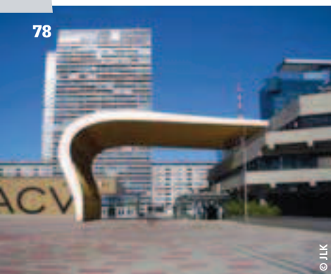
Austria Center Vienna