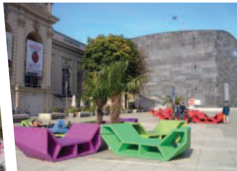
Le Museums Quartier